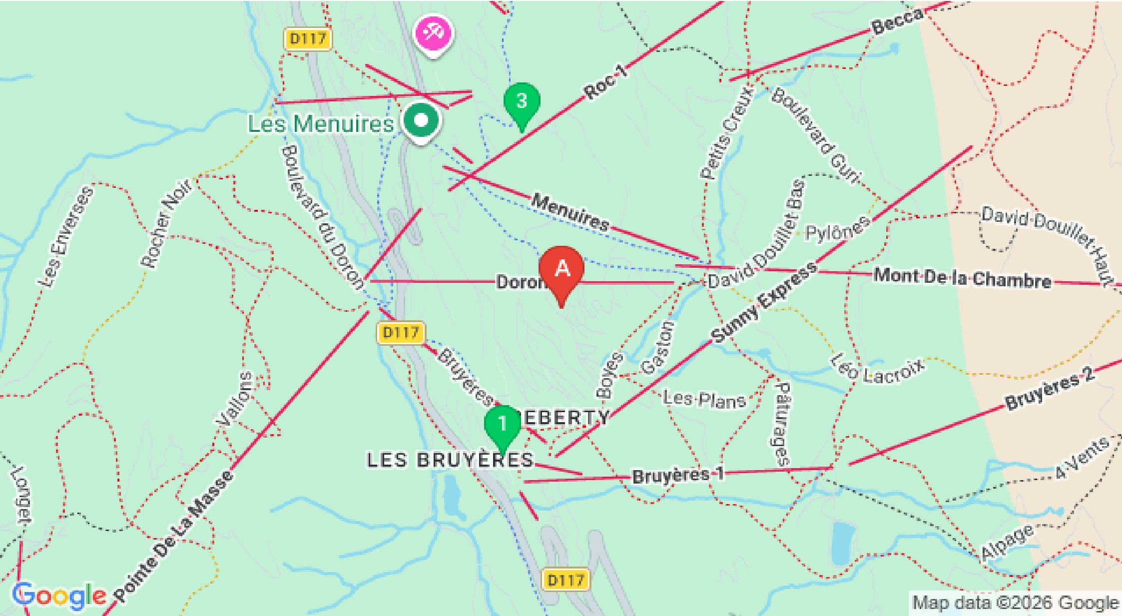
Map data ©2026 Google